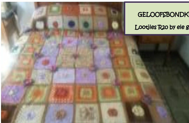
GELOOFSBONDKWILT 2 Lootjies R20 by eie gemeente